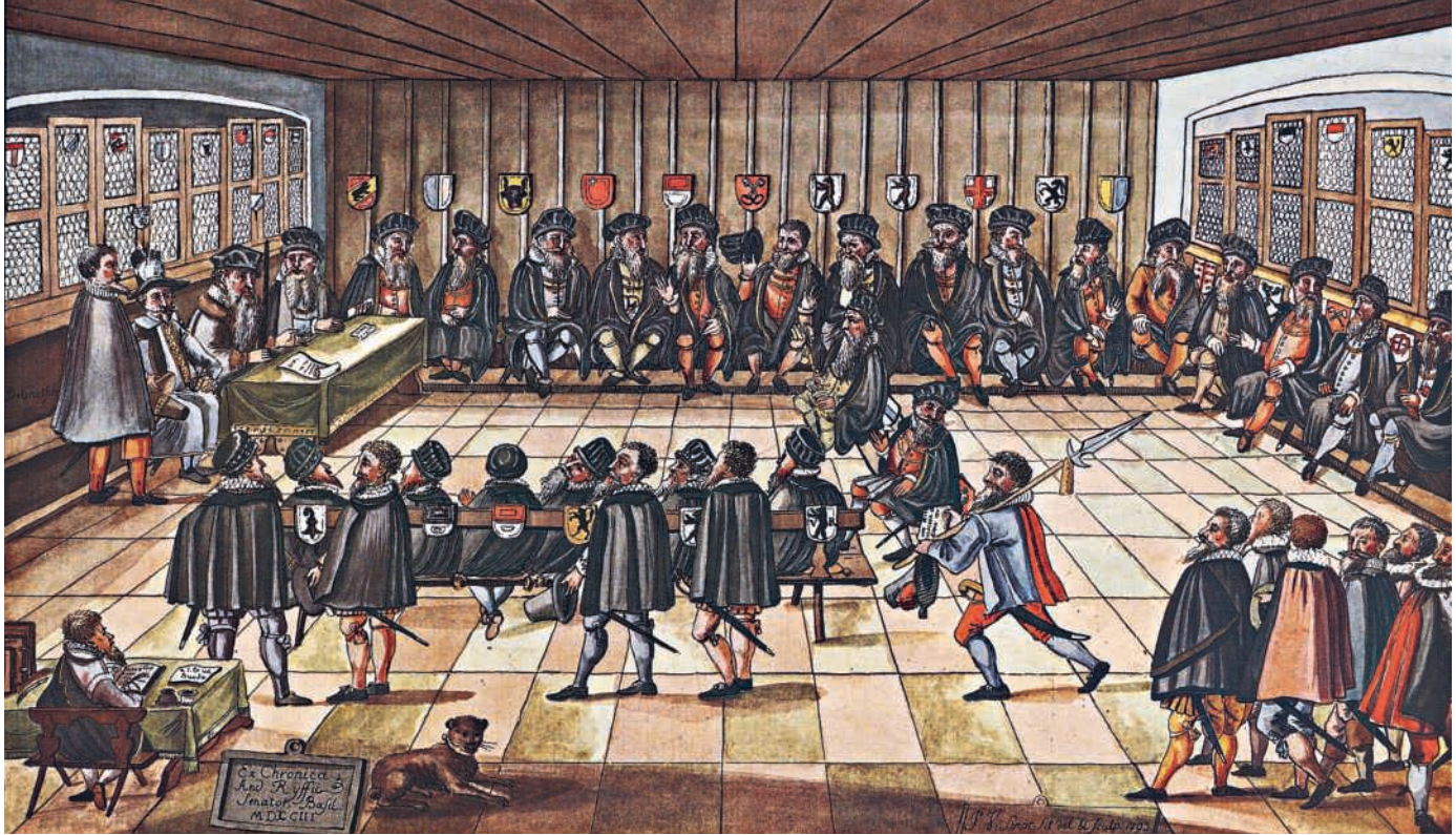
Die Tagsatzung zu Baden 1531.