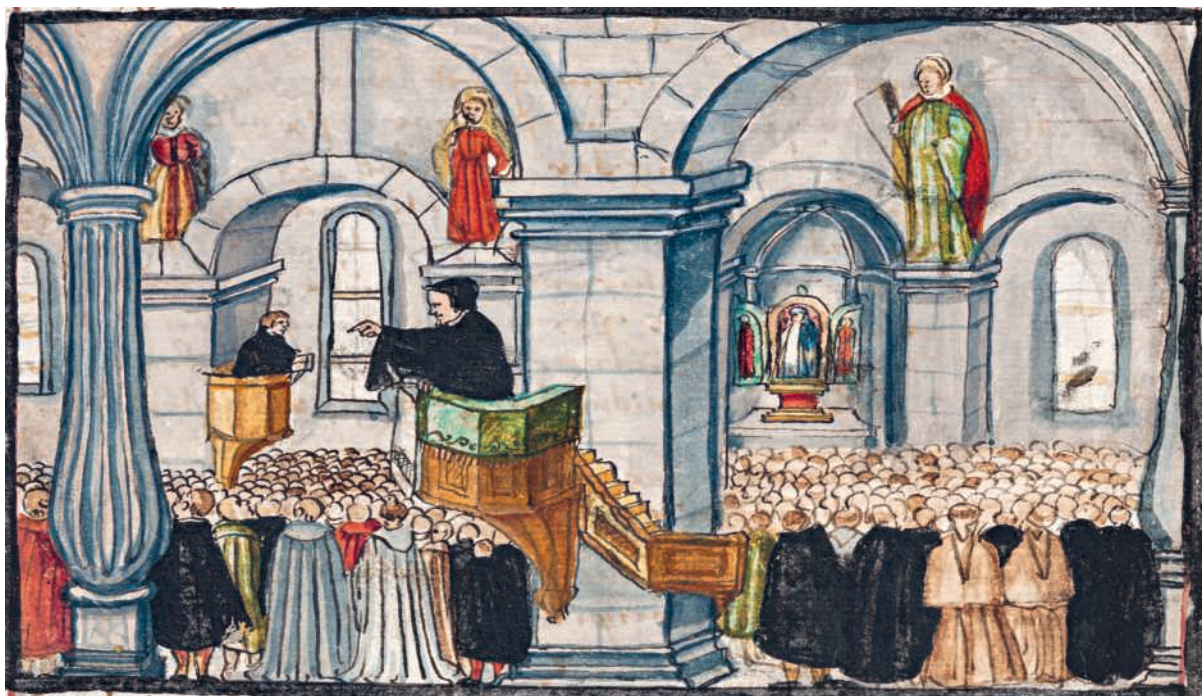
Die Badener Disputation mit den zwei Kanzeln in der Darstellung der Reformationschronik von Heinrich Bullinger (1504–1575) im Kopienband von 1605/06.

Die Badener Disputation fand vom 21. Mai bis 8. Juni 1526 statt. Dabei diskutierten katholische Theologen unter Johannes Eck und Reformatoren unter Huldrych Zwingli, der aufgrund von Sicherheitsbedenken nicht persönlich anwesend war, darüber, welche Lehre denn die richtige christliche Lehre sei.